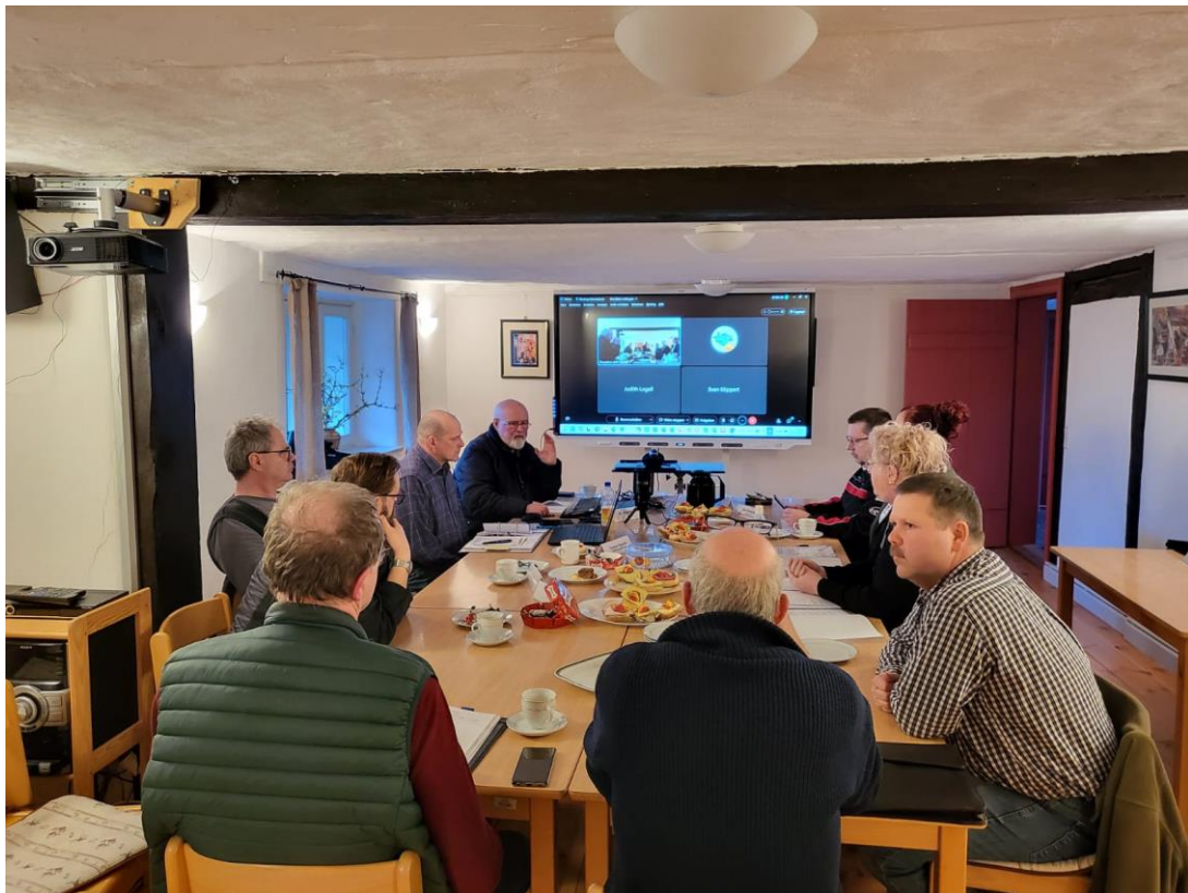
Abbildung 3: Teilnehmer/-innen des Workshops am 13.03.2023