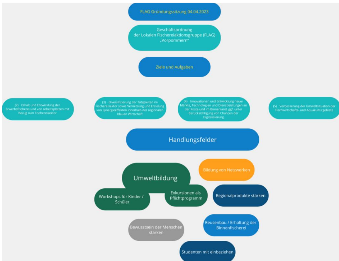
Abbildung 4: ConceptBoard des Workshops am 04.04.2023