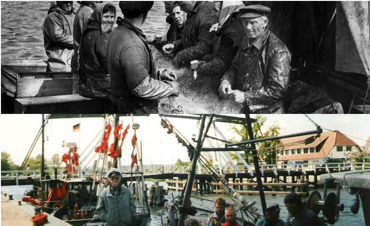
Abbildung 1: